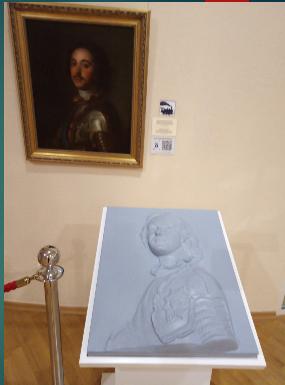
Музейное занятие «Портрет Петра Великого» с применением тактильного макета